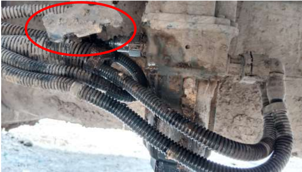
Bracket hose reposisi terkena matrial

Dari seluruh hasil observasi dan pemeriksaan Level adblue tiba-tiba drop to low karna adanya kebocoran adblue yang disebabkan oleh patahnya fitting pada hose adblue akibat terkena matrial yang membuat bracket pada hose bengkok yang membuat tertariknya hose adblue membuat fitting adblue tersebut patah