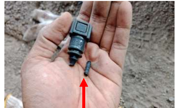
Konektor hose dan fitting patah terkena material