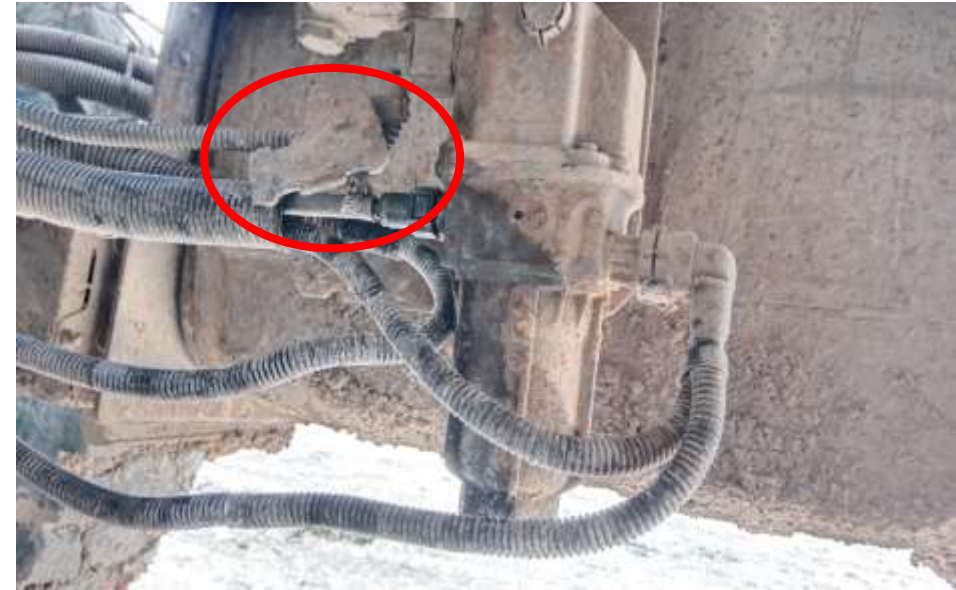
Bracket hose tampak jauh terlihat bengkok