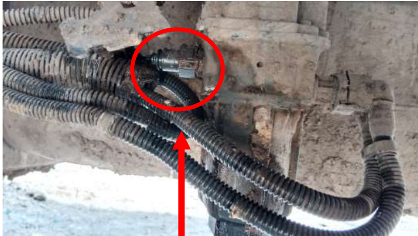
Fitting hose terlepas

Berdasarkan hasil dari seluruh pengecekan ditemukan adanya hose yang lepas/fitting yang patah di pompa adblue yang menyebabkan kebocoran adblue