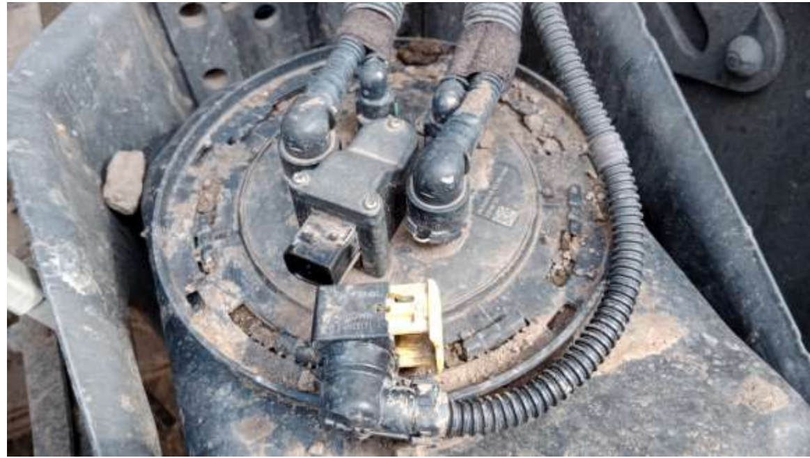
Pengecekan Sensor level adblue

melakukan pengecekan dan membersihkan pada socket sensor level adblue