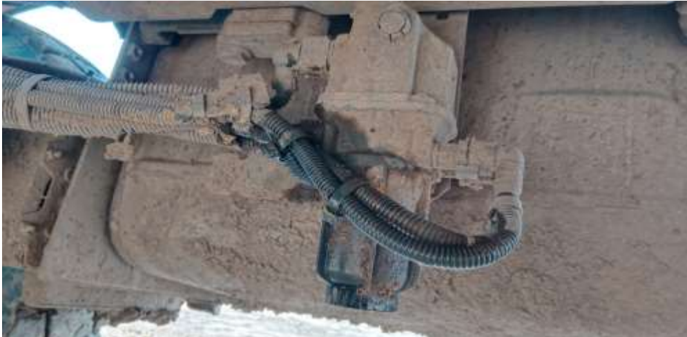
Lokasi terjadinya tumpahan cairan

Setelah memeriksa secara actual level adblue dan kemudian menambahkan cairan adblue selanjutnya engine di running, sesaat setelah engine di running terlihat ada tumpahan cairan dibawah unit.