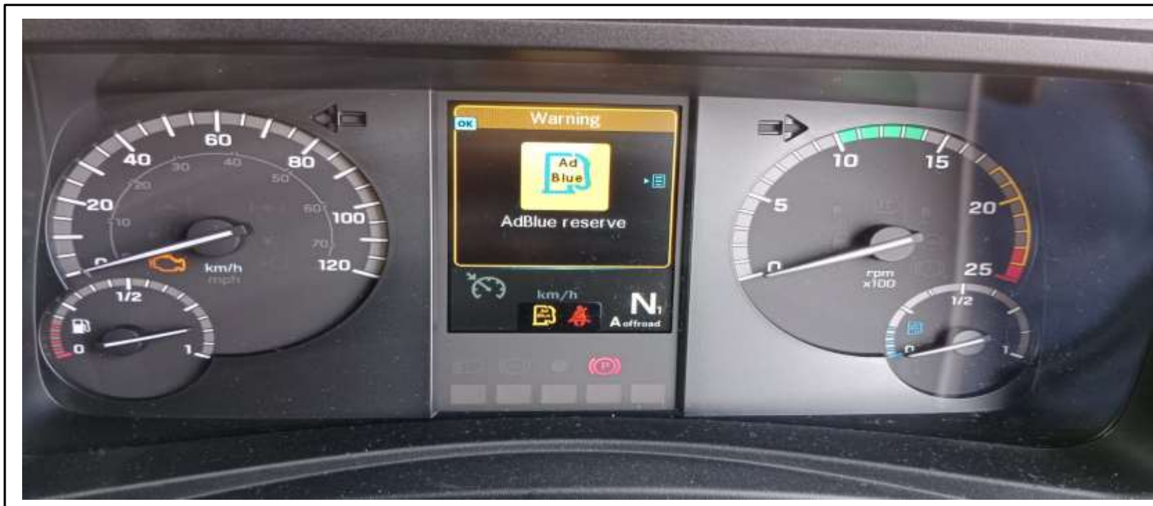
Peringatan yang muncul di monitor dan level adblue low

Driver menginformasikan pada saat jalan level addblue tiba-tiba habis padahal pada saat awal perjalanan level addblue masih sekitar 75%. Dan pada saat yang sama muncul peringatan di monitor.