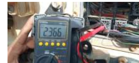
Cek output cable sensor

Pemeriksaan pada fisik speed sensor yang terpasang dibagian belakang output transmisi sebelah kiri atas.