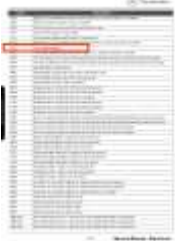
Penjelasan kode error pada FR

Kode error pada FR menampilkan kode (4341) dan deskripsi pada kode tersebut adalah invalid speed signal yang artinya dari sensor speedometer tidak dapat mengirimkan Signal ke instrumen cluster yang menunjukkan kecepatan kendaraan untuk ditampilkan kepada driver