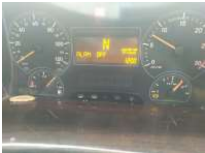
Speedometer tidak berfungsi

Driver menginformasikan bahwa speedometer mati, Setelah memasuki jadwal periodical service kemudian saya Mengecek pada unit tersebut dan ternyata speedometer tidak berfungsi dan terdapat kode error FR yang muncul