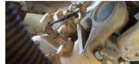
Lokasi fisik speed sensor