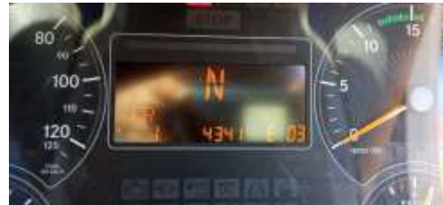
Kode error FR yang ditampilkan