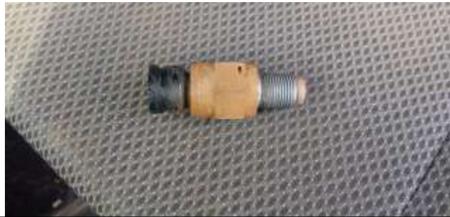
Fisik speed sensor