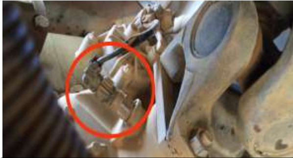
Lokasi speed sensor