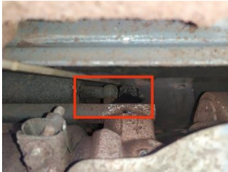
Shaft dan silinder tidak center