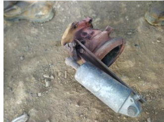
exhaust break setelah dilepas