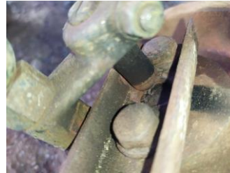
shaft flap terlihat jelas patah