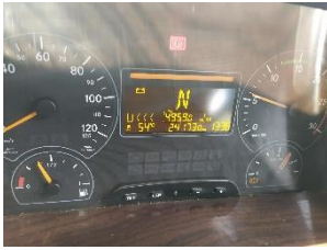
Lambang battery muncul