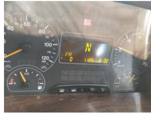
Kode error FR 1