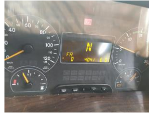
Kode error FR 2